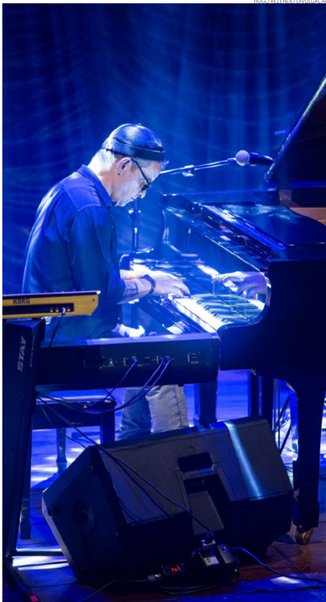
Músico afirma que buscou inspiração nas paisagens do Cerrado

A colaboração com Toninho Horta, um dos grandes nomes da música instrumental brasileira, foi um dos pontos altos da produção de "Pedra de Paraúna". Horta, vencedor do