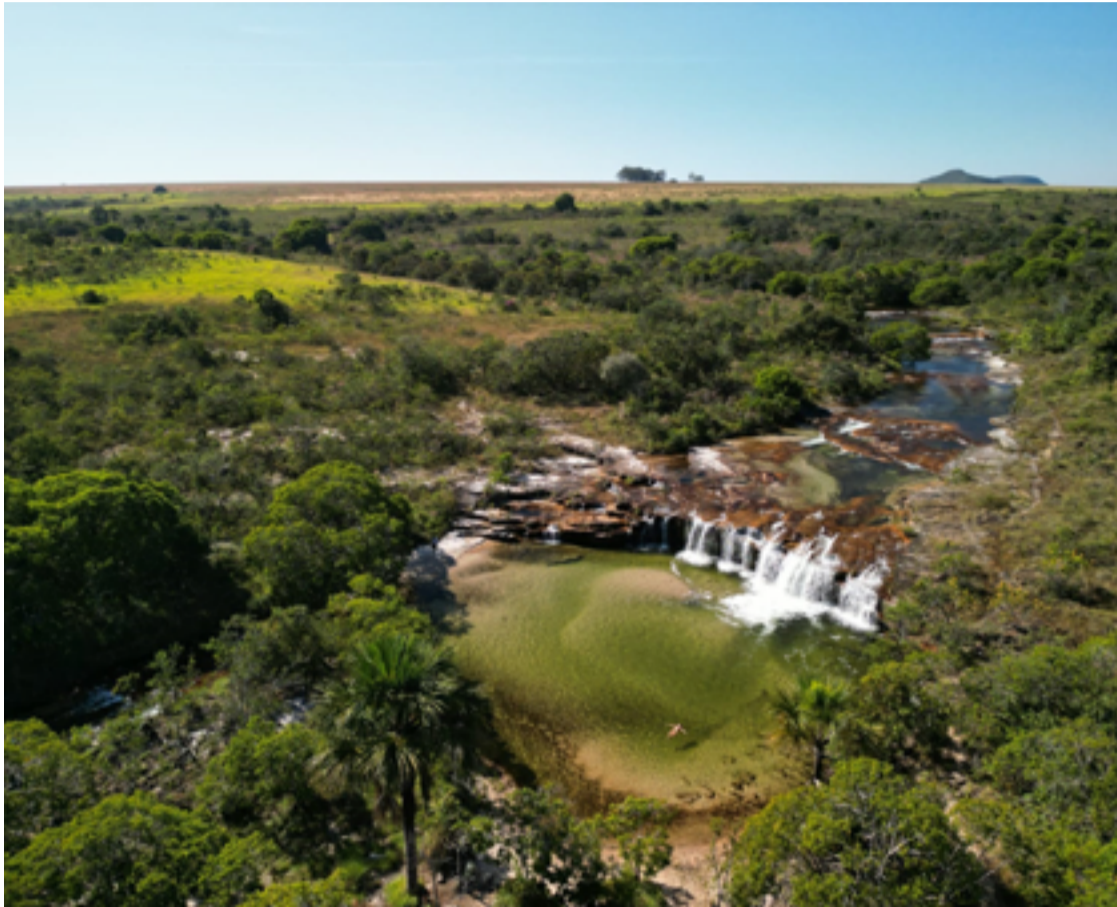
7.850 prestadores de serviços turísticos que atuam de forma legal em 2024

Documento comprova que profissionais e empresas turísticas estão regulares e garante segurança ao turista e vantagens aos trabalhadores da área. Números confirmam o fortalecimento e o potencial de expansão do setor no estado