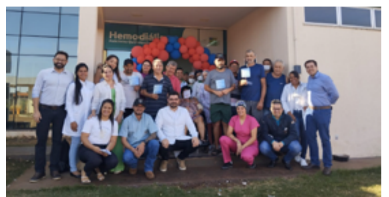
Com implantação do 3º turno, serviço de hemodiálise passará a beneficiar 42 pacientes da região