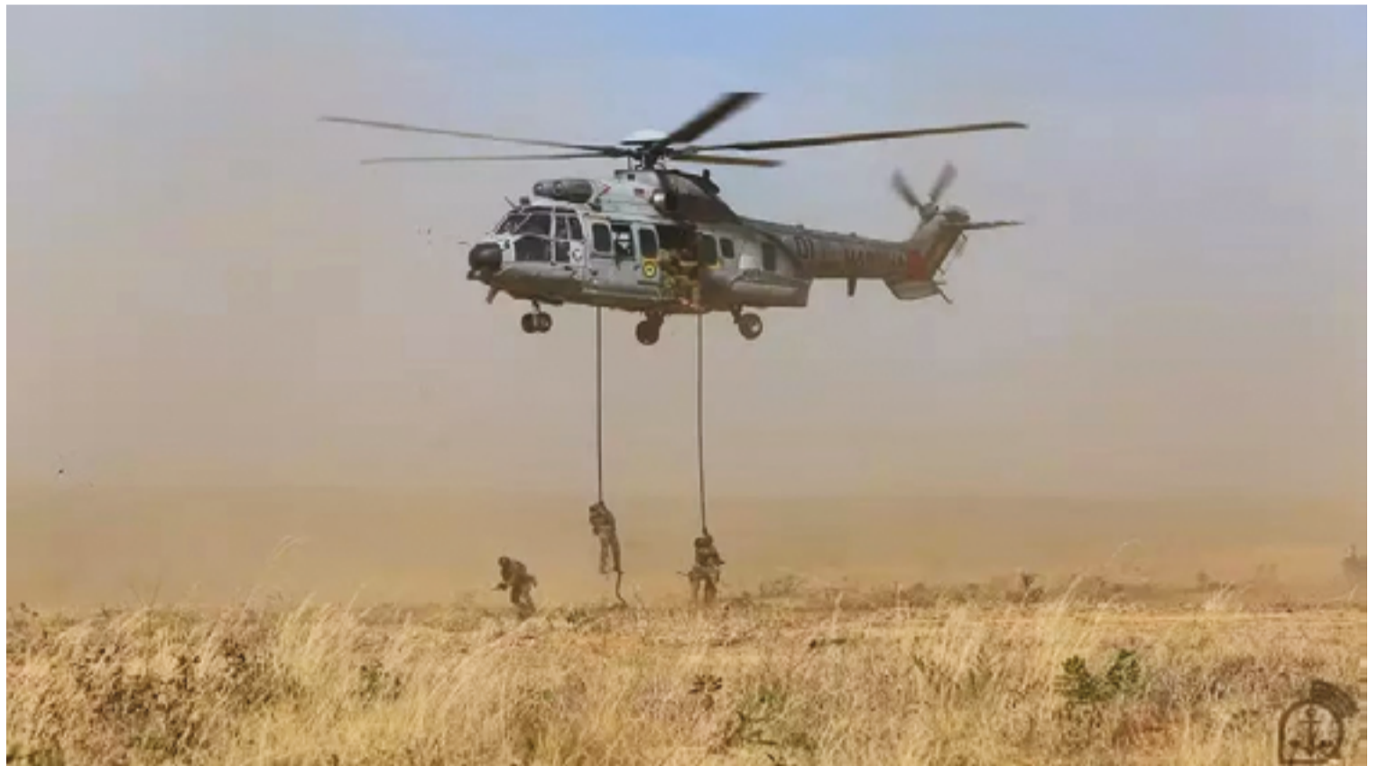
Ação, iniciada em 4 de setembro, vai até dia 17, e mobiliza mais de 3 mil militares do Exército, Marinha e Aeronáutica

Esta é a primeira vez que a China participa ativamente com tropas constituídas. Em edições anteriores, os militares chineses atuaram