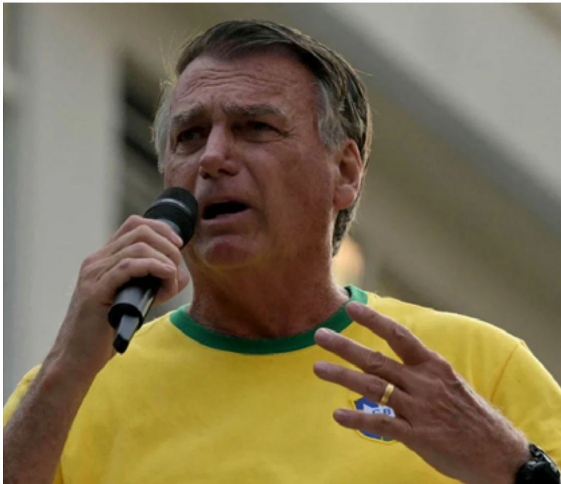
Jair Bolsonaro: críticas ao STF e apoio ao impeachment de Alexandre de Moraes

Já Tarcísio, em sua fala, evitou ataques diretos ao ministro do STF e exaltou o governo do ex-presidente, pedindo “volta, Bolsonaro”. “Que esse mar de gente sirva de inspiração aos nosso congressistas para que a gente possa conquistar de volta a nossa liberdade para que não haja censura, não haja banimento de rede, para que não