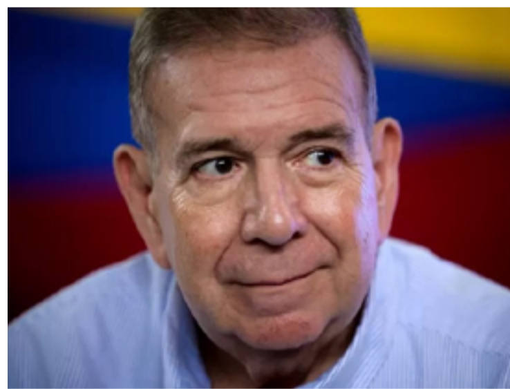
González Urrutia deixou o país sul-americano neste domingo, 8 de setembro, a bordo de um avião da Força Aérea

Ministro Albares confirmou que González Urrutia solicitou o direito de asilo, que será "naturalmente" concedido pelo governo espanhol. O ministro reiterou o compromisso da Espanha com os direitos políticos e a integridade física de todos os venezuelanos.