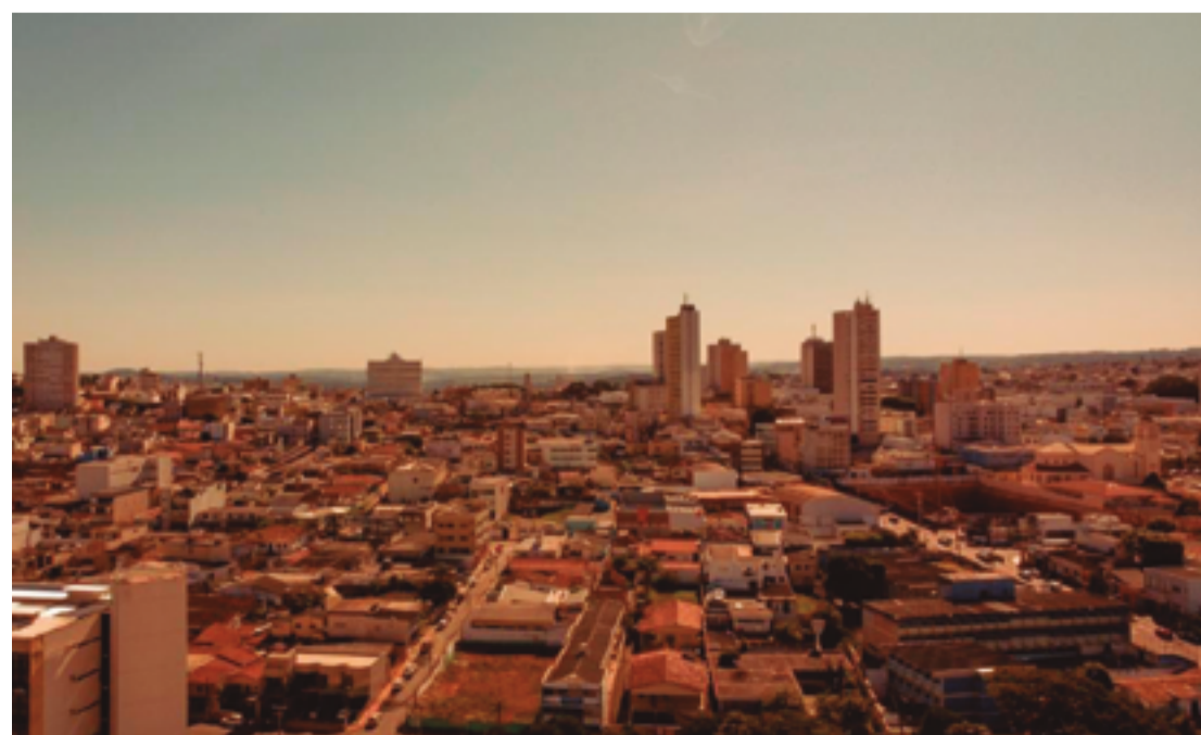
Cimehgo informa que há uma frente fria prevista entre dias 17 a 20

"No cenário até o dia 15 não temos chuvas. Há uma