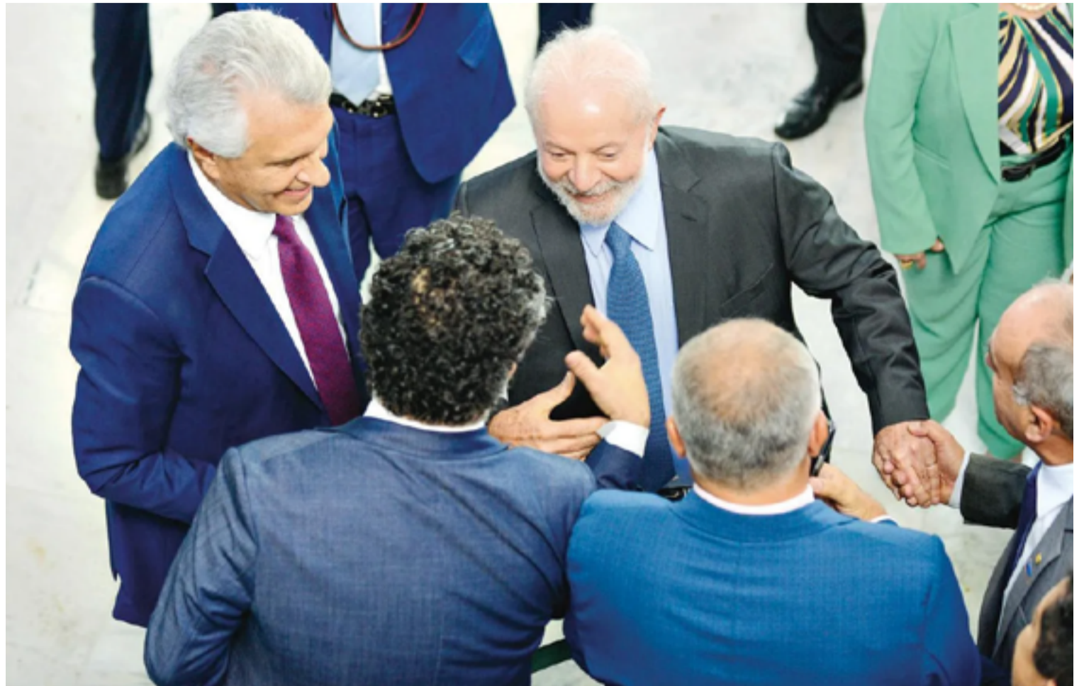
Ronaldo Caiado e Lula da Silva: divergência ideológica e diálogo respeitoso

“Eu não peço o Caiado para falar bem de mim, ele não tem que me pedir para falar bem dele. Ele tem um pensamento ideológico, eu tenho outro, mas acontece que ele é o governador do Estado e eu sou o presidente da República. Nós temos que ter uma relação civilizada, nos tratar com respeito, porque quem ganha com isso é o povo”, explicou, e afirmou que todas as visitas que tem feito às federações do país são precedidas de convites aos governadores e prefeitos, independente de cor partidária.