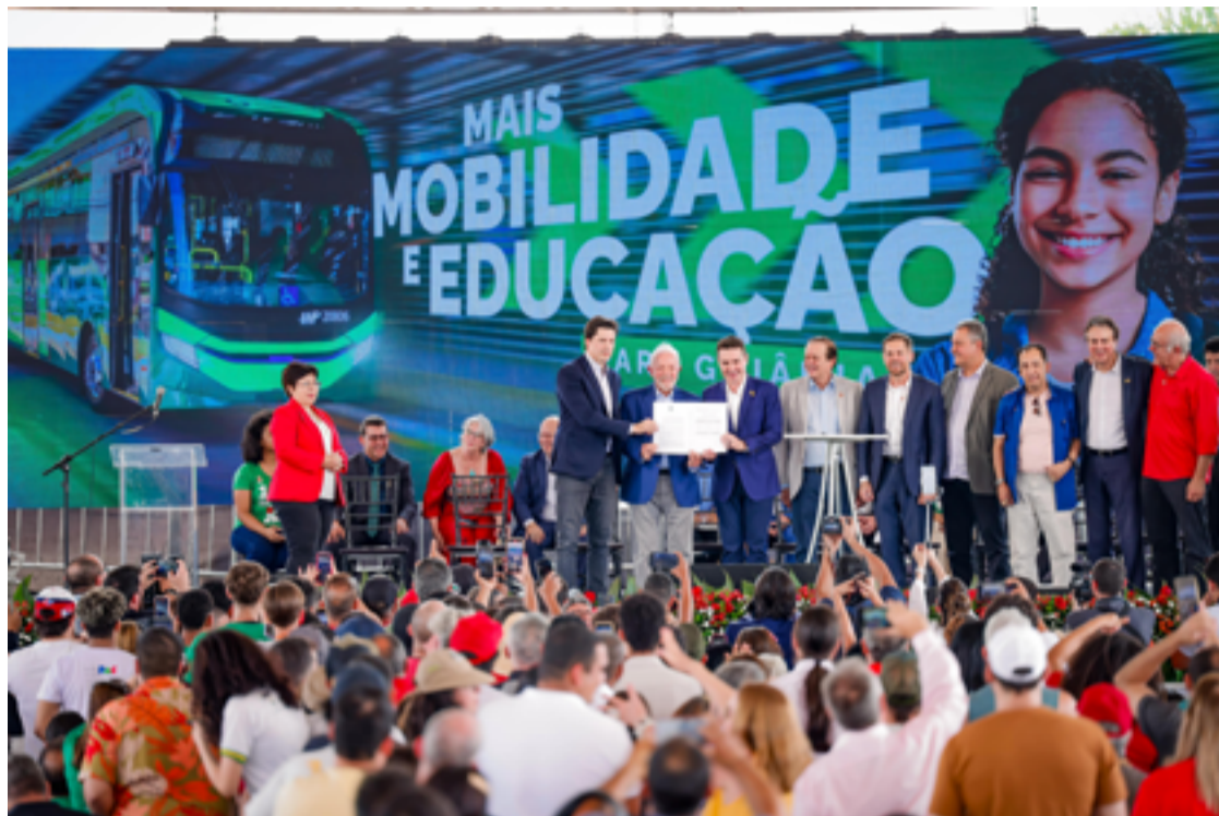
A visita de Lula teve como destaque o lançamento de um trecho do BRT Norte-Sul, que agora conta com 60 novos ônibus adquiridos pelo Governo de Goiás

A visita de Lula teve como destaque o lançamento de um trecho do BRT Norte-Sul, que agora conta com 60 novos ônibus