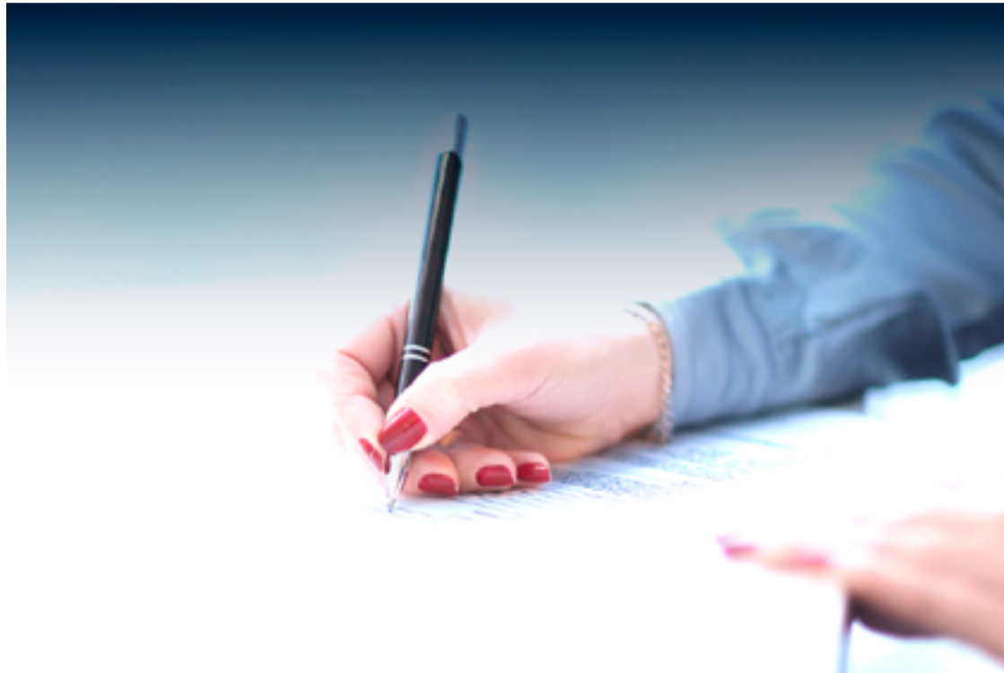
Município foi proibido de nomear qualquer pessoa já condenada

A condenação a mais de 4 anos de reclusão foi confirmada em segundo grau pelo Tribunal de Justiça do Distrito Federal e dos Territórios. Nela, foi acrescentada a pena pecuniária de 17 dias-multa, em