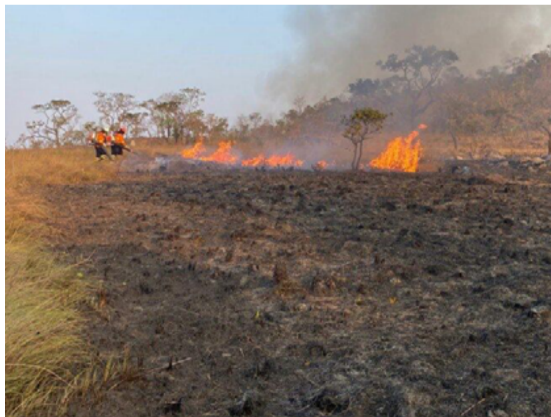
Qualidade do ar piora com queimadas e baixa umidade