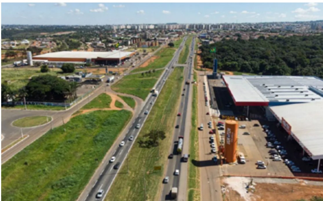
Valparaíso de Goiás contabiliza 25.440 empreendimentos ativos

"É um reflexo da força empreendedora da nossa população, dos atrativos fiscais oferecidos pelo estado para investimentos, capacitação e