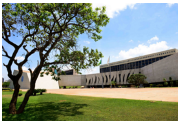
STJ restabeleceu decisão do juízo de primeiro grau