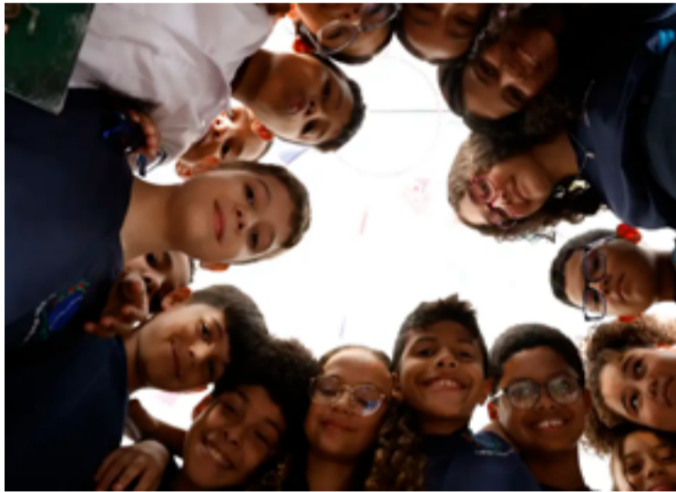
Plenarinho destaca importância de a juventude participar da política

Uma dessas experiências destinada à educação eleitoral é o Projeto Plenarinho, da Câmara dos Deputados